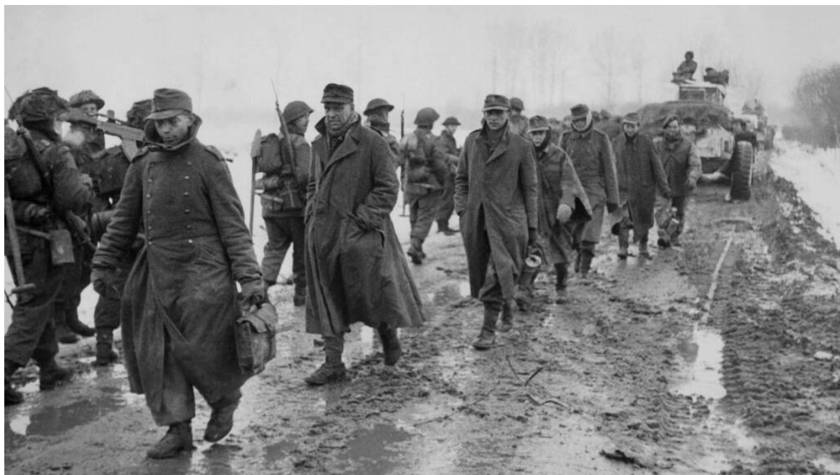
Duitsers geven zich over bij Echt

In Sint Joost durfden Duitse militairen pas uit de kelder te komen toen een Nederlandse burger een veilige aftocht had bedongen bij de Britten. Daarna kwamen ze een voor een met de handen omhoog en lieten zich ontwapenen. " Sankt Joost, dass war eine Hölle ", concludeerde een overwonnen militair.