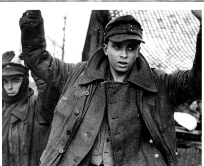
Duitsers geven zich over en worden via de Sint Joosterweg afgevoerd. Boven: ravage van de vlammenwerpers.

den ze. Zulke jonge jongens. Ze dachten dat ze in Duitsland waren, maar ze waren de grens nog niet over. Die stonden te janken.“ Dag en nacht zijn er beschietingen over en weer; gewonden worden met kar en paard door de granaatregens heen naar het ziekenhuis in Roermond gebracht. Veel huizen in